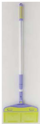
長さ160cmまで調整可能